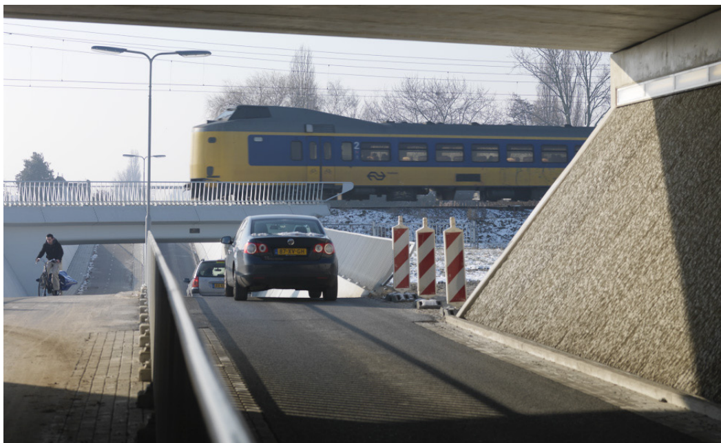
Eerste doel van het Platform Slim Werken Slim Reizen is dat eind 2012 zo'n 1 miljoen werknemers slim kunnen werken en reizen. Dat betekent dat zij ervoor kunnen kiezen 1 of meer dagen per week niet naar het werk te reizen.

• “De kunst voor IenM • is dan vooral door • te praten, niet door • te drukken.”