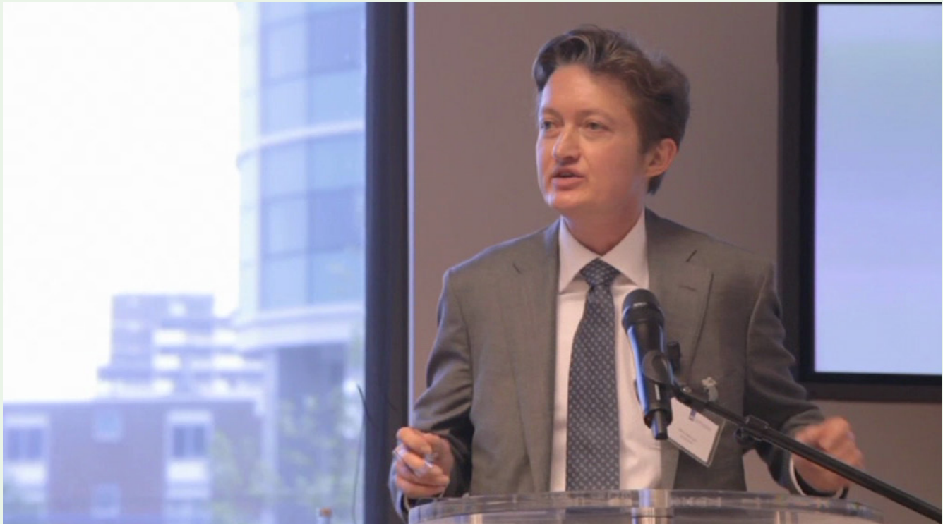
Essayist Maxim Februari tijdens zijn prikkelende voordracht