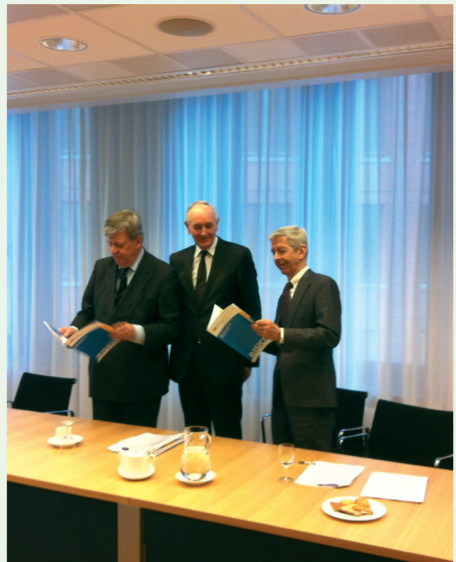
Commissaris van de Koningin Noord-Holland (Johan Remkes) overhandigt de brochure aan de ministers BZK (Ronald Plasterk) en V&J (Ivo Opstelten).