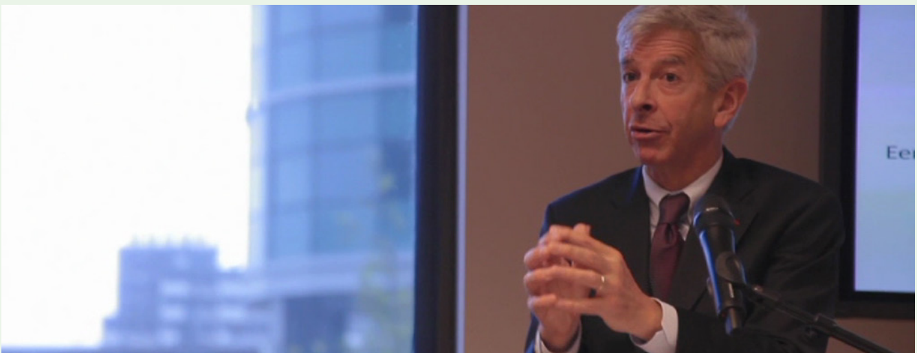
De minister bij de opening van de bestuurlijke bijeenkomst

De burger kan echt wel wat hebben als het gaat om risico's. Dat is een van de conclusies van een discussiebijeenkomst over burgers en risico's. De bijeenkomst vond plaats op 30 mei 2013 op het ministerie van BZK.