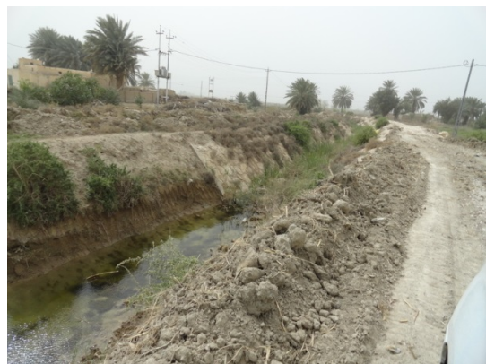
Begin van het irrigatiekanaal, nabij de Eufraat