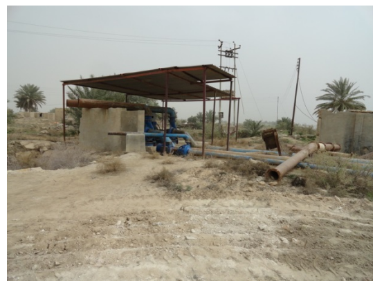
Waterpompen in het dorp Sayed Nasir