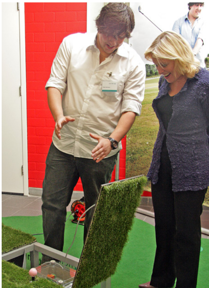
Minister Bussemaker bestudeert en test de mobiele golfbaan door studenten ontwikkeld

Een belangrijke randvoorwaarde hierbij is transparantie van processen. Hoe transparanter het proces, bijvoorbeeld de vraagontwikkeling, hoe efficiënter de organisatie kan worden ingericht. ■