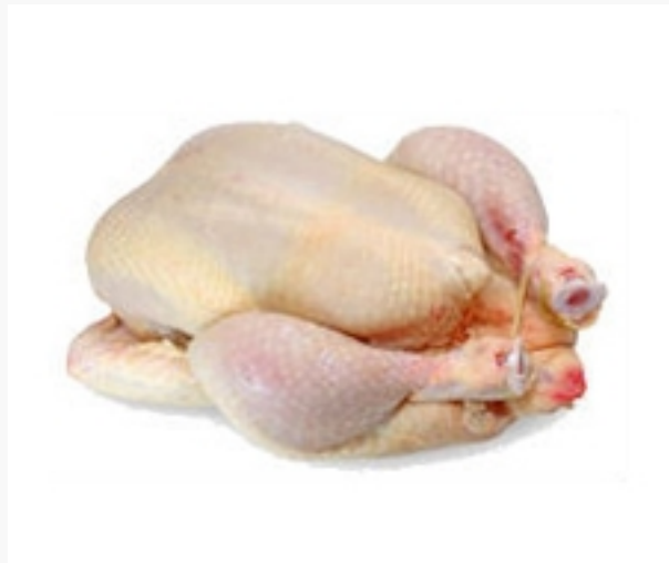
Vleeskuiken geslacht op 6 weken leeftijd

De 192 eieren, die in Nederland gemiddeld per persoon per jaar worden gegeten, komen overeen met ongeveer 70% van de jaarlijkse productie van een leghen. Leghennen worden na ruim een jaar produceren vervangen. Omdat er evenveel haantjes als hennetjes geboren worden, zijn er per gezin van 2-4 personen per jaar dus twee à drie haantjes, die bij de jaarlijkse consumptie van eieren horen en twee à drie soepkippen.