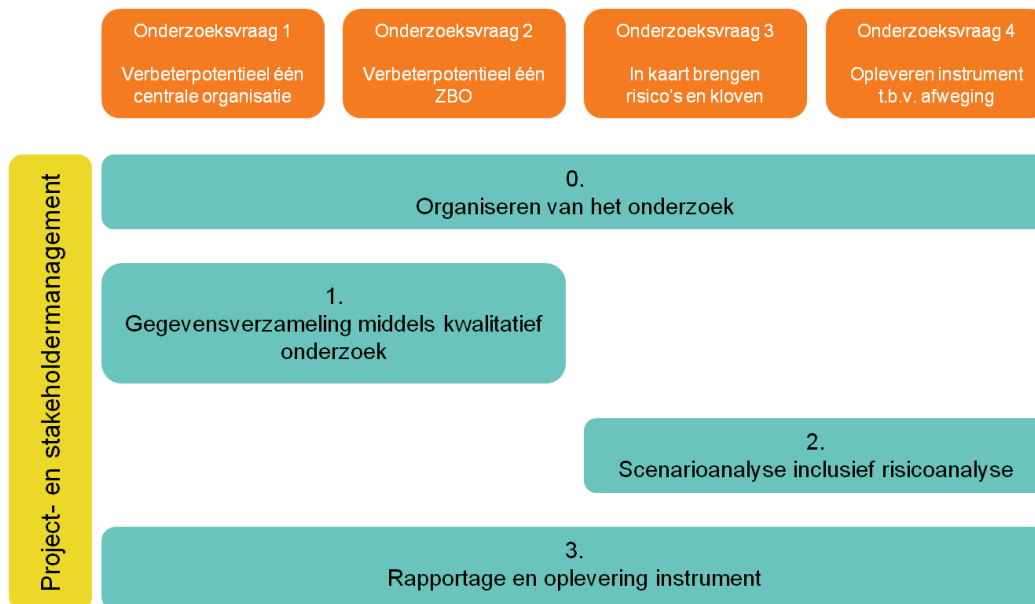
Figuur 1. Plan van aanpak - conceptueel raamwerk van de te zetten stappen

14 Hieronder worden de belangrijkste stappen uit het onderzoek kort toegelicht.