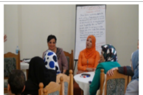
Foto: trainingssessie 'hoe stel ik Kamervragen'