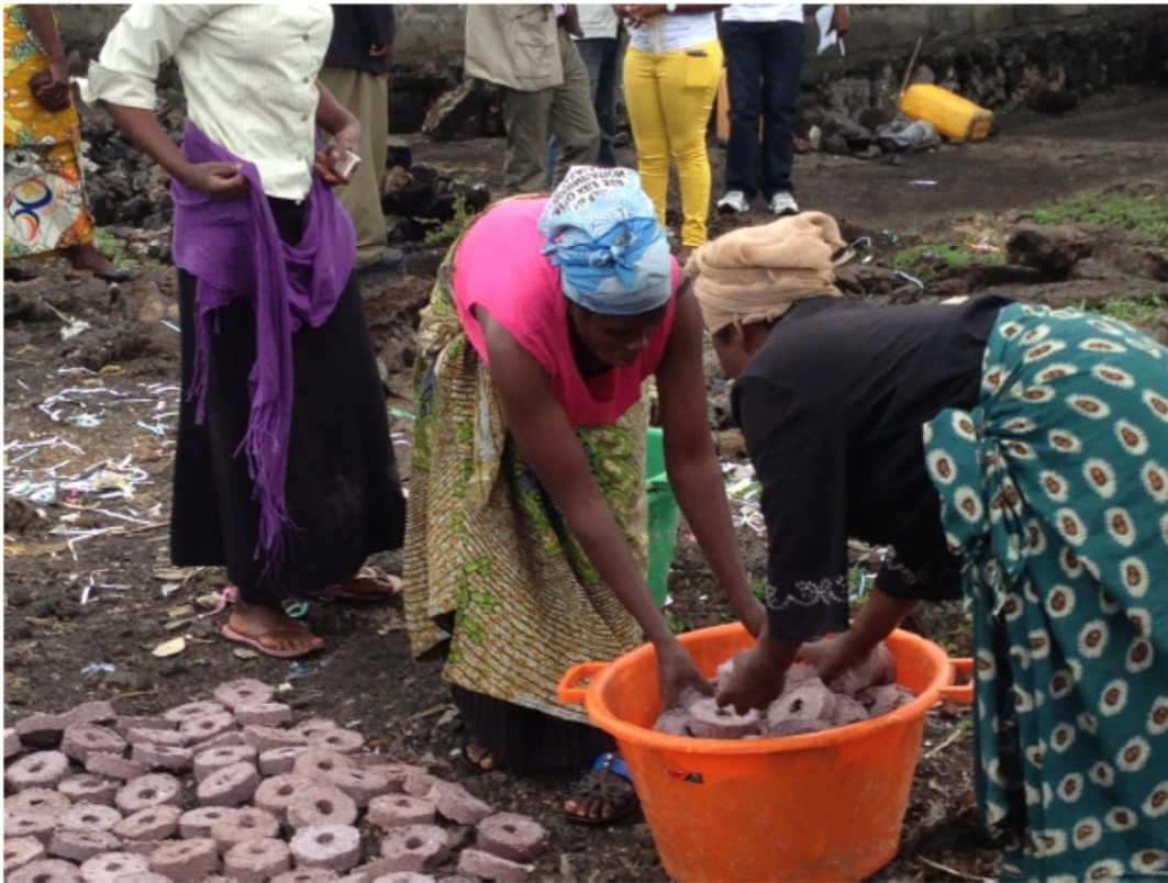
Foto's: Project voor alternatieve brandstoffen en betere ovens in ontheemdenkampen.