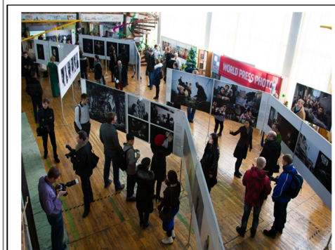
Ter gelegenheid van Mensenrechtendag organiseerde de ambassade een World Press Photo-tentoonstelling.

Uitgaven uit het Mensenrechtenfonds in 2013, verdeeld naar thema.