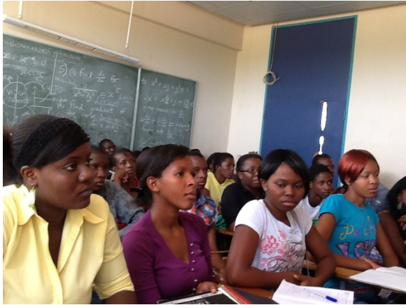
Foto 1: Media les voor vrouwen aan de University of Science and Technology.