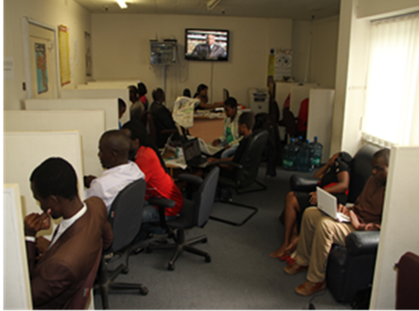
Foto 2: journalisten aan het werk in een media centrum in Harare.