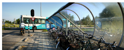
Voor- en natransport

Vanuit het Actieplan 'Groeï op het Spoor' is een investeringsimpuls beschikbaar gesteld. Cofinanciering is hierbij als uitgangspunt genomen. Dit betekent dat de betrokken partijen (vervoerders, regionale overheden en grondeigenaren) zelf ook een financiële bijdrage moesten leveren. Iedere organisatie heeft vanuit zijn eigen rol, capaciteit en middelen bijgedragen aan het realiseren van