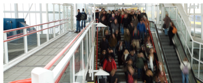
Spreiding van mobiliteit