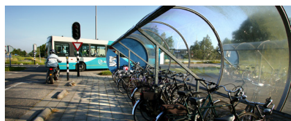
Voor- en natransport

Een belangrijke behoefte van treinreizigers is de mogelijkheid om