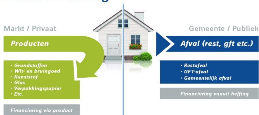
Figuur 1. Weergave van vervuiler betaalt principe toegespitst op huishoudelijk afval