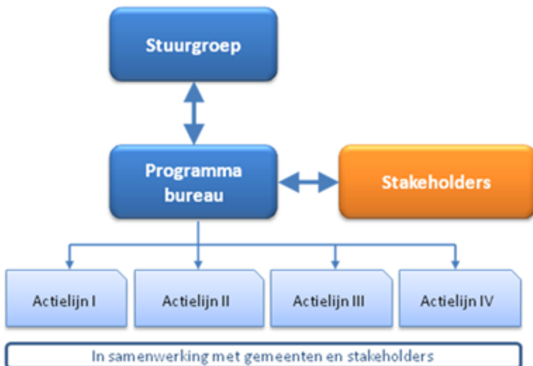
Figuur 3: Schematische weergave organisatie Uitvoeringsprogramma VANG – Huishoudelijk Afval

Het Programmabureau zorgt dat bij het opstellen van het werkplan nadrukkelijk een klankbord wordt gezocht met deze belangrijke partijen voor het realiseren van de gestelde doelen. Verder zullen deze partijen bij de individuele acties betrokken worden en deelnemen, vanuit hun eigen taken en verantwoordelijkheden.