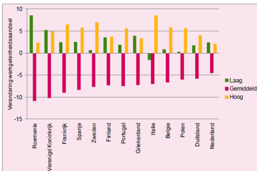
Figuur 2: De verandering van werkgelegenheidsaandelen van laag, gemiddeld en hoog betaalde banen in Europa (1998-2010).