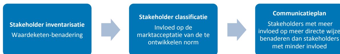
Figuur 3. Stakeholderanalyse NEN

Bevinding 7 – Binnen NEN is een toolbox ontwikkeld voor de uitvoering van stakeholderanalyses. De stakeholderanalyse methode bestaat uit drie stappen en is in samenwerking met de Erasmus Universiteit verder doorontwikkeld (figuur 3).