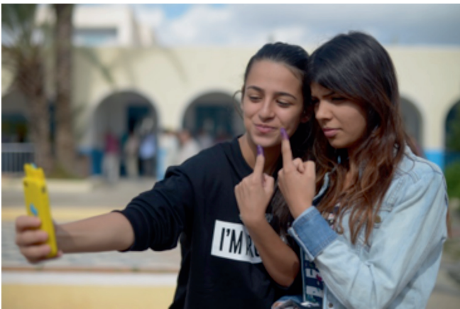
Jonge vrouwen fotograferen zichzelf tijdens de verkiezingen in Tunesië (Hamideddine Bouali, 2014).

IOB onderzocht de Nederlandse bijdrage aan de bevordering van democratische transitie in de Arabische regio voor de periode 2009-2013. Deze evaluatieperiode betreft een tijdvak van twee jaar voorafgaand en twee jaar volgend op de golf van protesten. De gedachte was dat kansen voor democratisering en de ontwikkeling van de rechtsstaat steun verdienen en uiteindelijk de Nederlandse belangen dienen op het gebied van handel, energievoorziening, het tegengaan van illegale migratie en veiligheid.