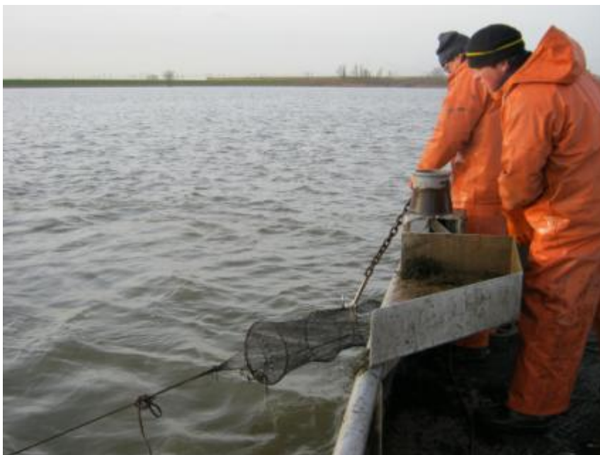
Ophalen van begin van een treintje schietfuiken