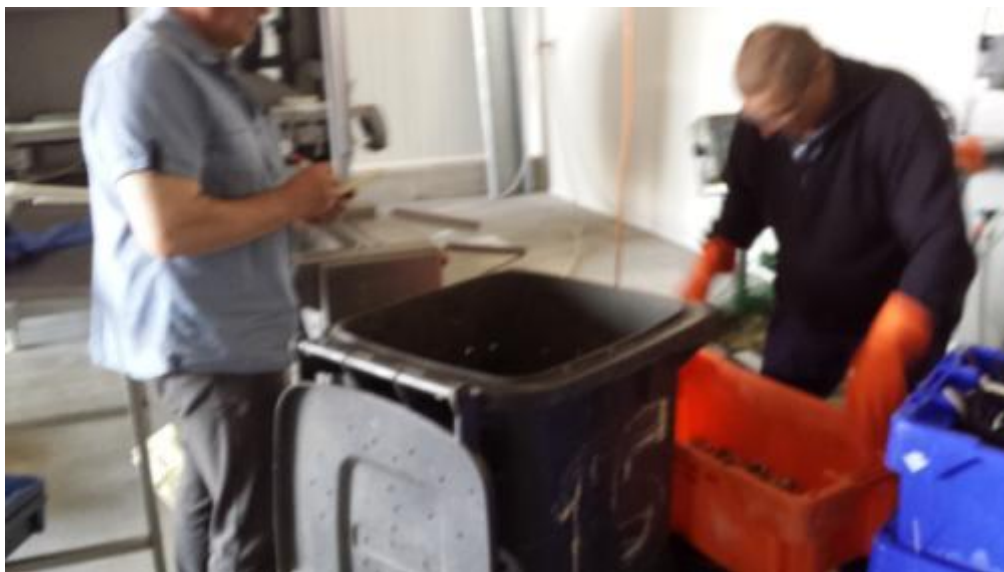
5 juni 2015; In aanwezigheid controleur G4S worden krabben per net geteld door verwerkingsbedrijf; Krabben gaan daarna in klike voor afvoer door Rendac; controleur G4S noteert aantallen krabben per net