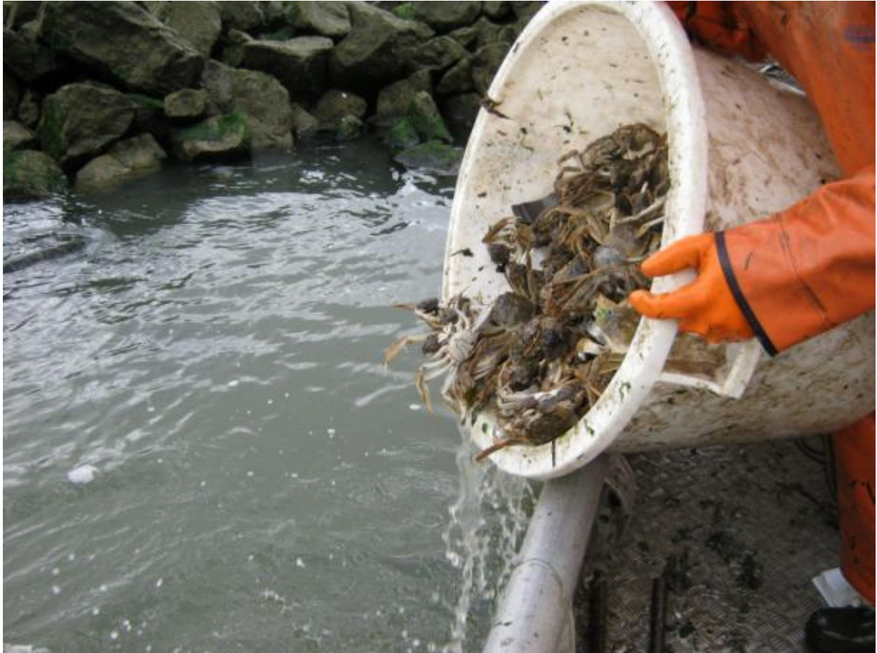
Vangst minus 3 x 5 kg verpakt in verzegelde netten wordt terugzet