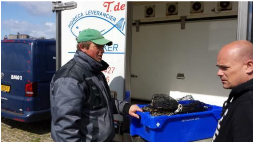
Overdracht van bak met verzegelde netten aan transporteur voor vervoer naar verwerkingsbedrijf in Urk