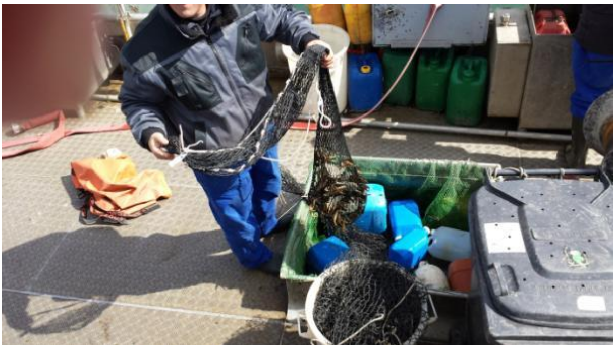
Aanlanding: Verzegelde netten worden uit de bun gehaald