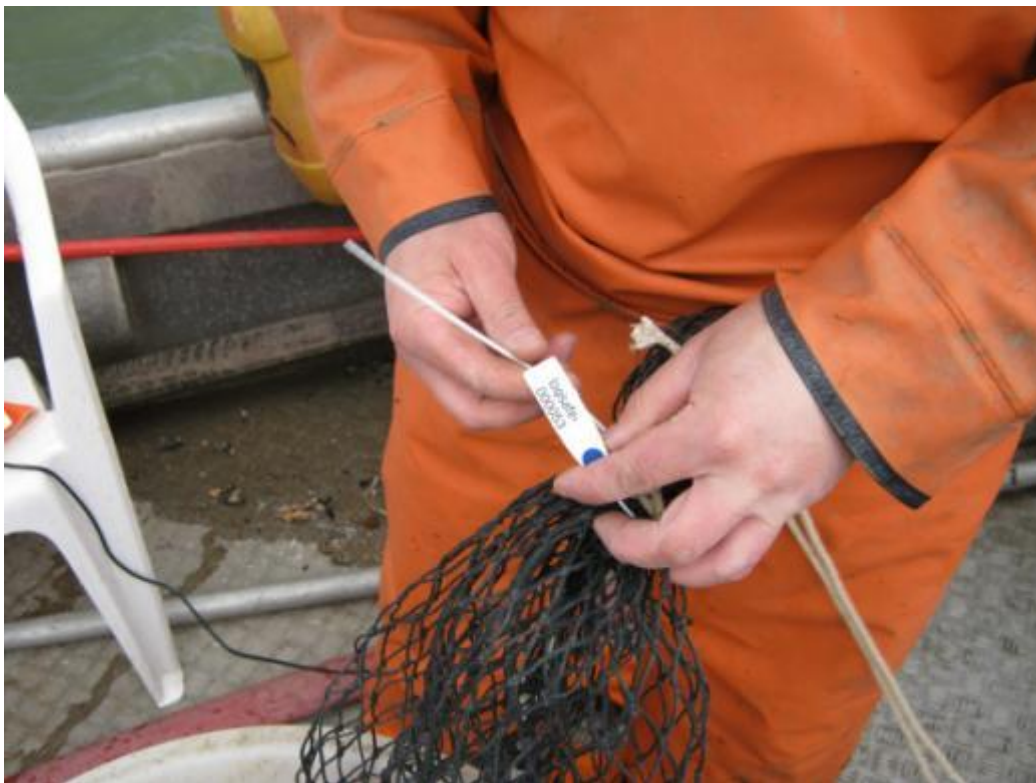
Verzegeling van netten met uniek zegelnummer