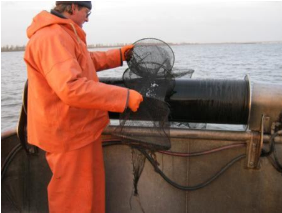
Binnenhalen van de schietfuiktrein