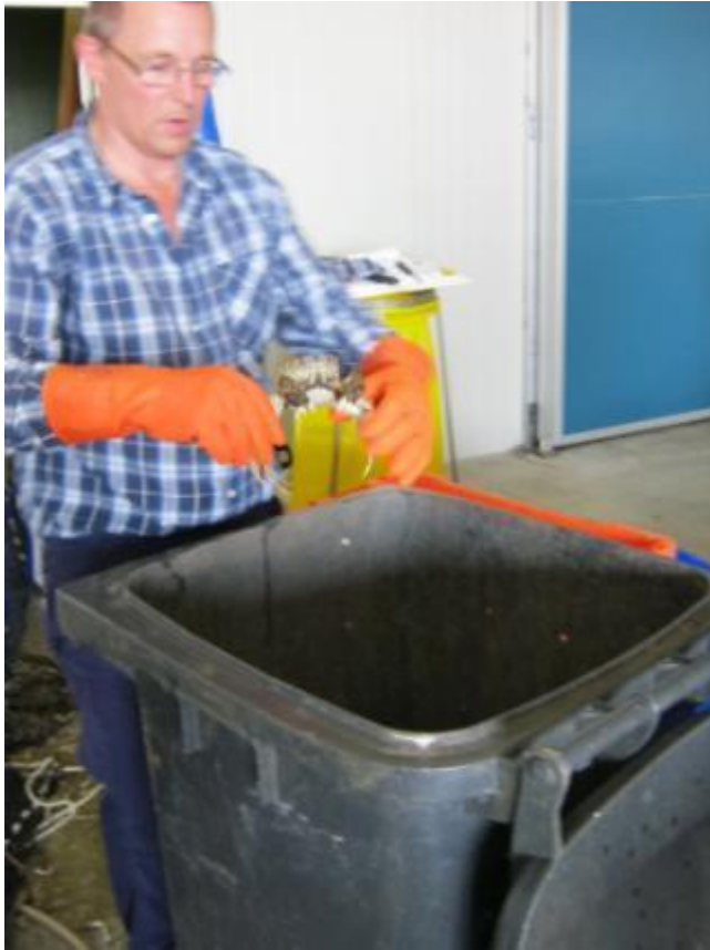
5 juni 2015: Wolhandkrabben gaan in klike voor afvoer door Rendac