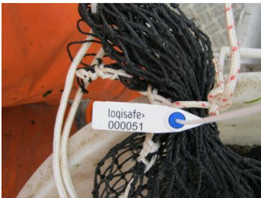
Zegel met uniek zegelnummer