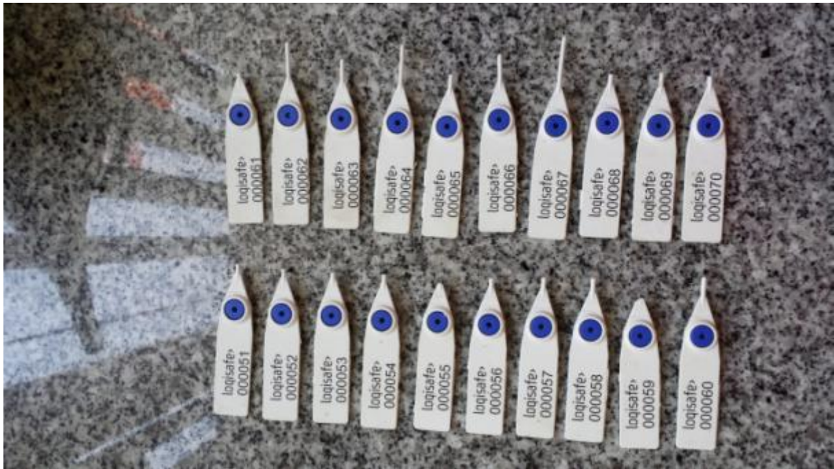
5 juni 2015 : Overzicht verwijderde zegels