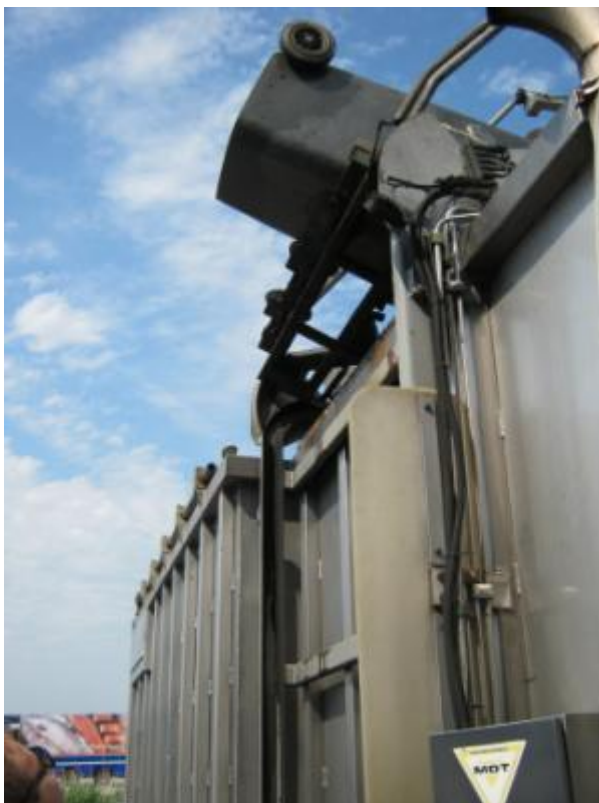
5 juni 2015: Klike's worden geleegd in vrachtwagen Rendac