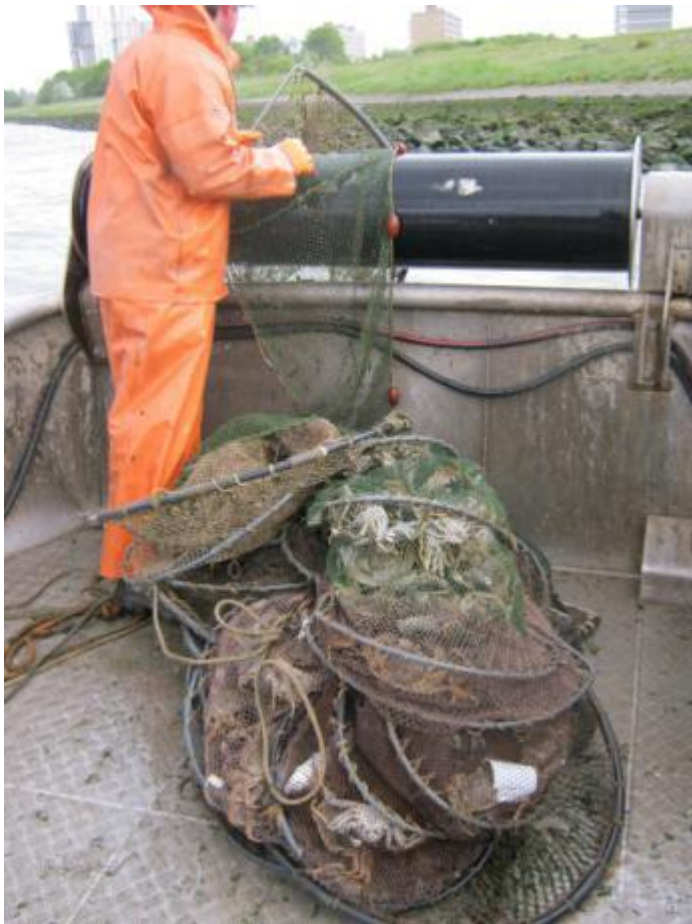
De helft van het treintje schietfuiken - vol met krabben - is binnen