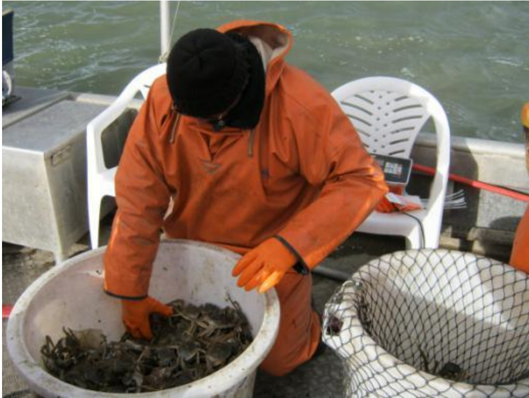
Wolhandkrabben sorteren; ca. 5 kg na tellen in net verpakt