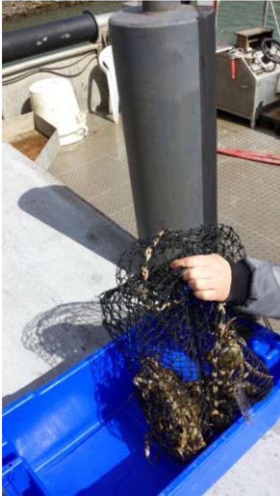
Verzegelde netten worden bij aanlanding geplaatst in bak van transporteur