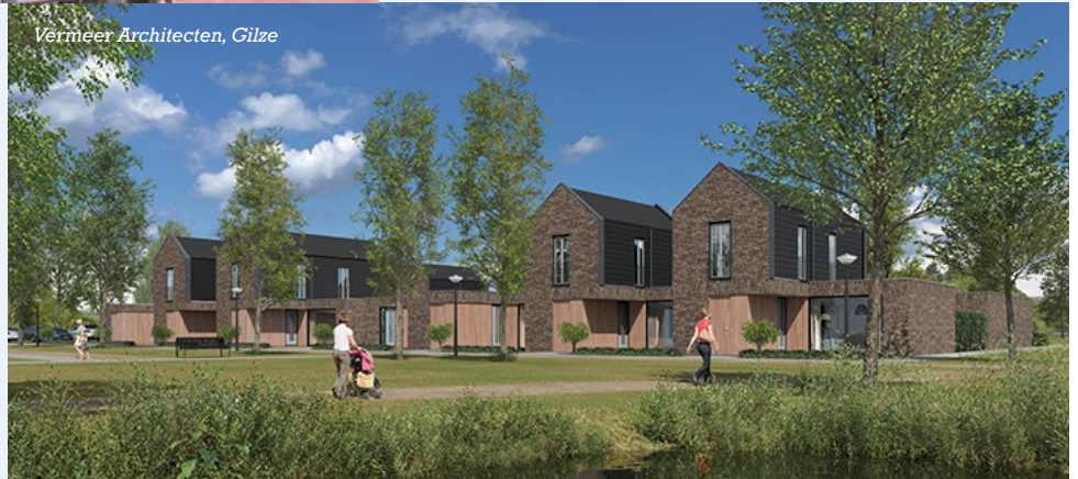
Vermeer Architecten, Gilze