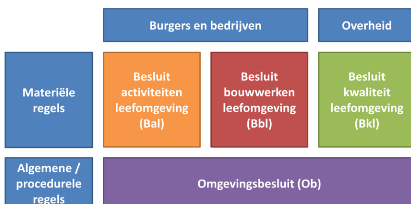
Figuur 1.1 - de indeling van de AMvB's

De gekozen indeling van de AMvB's betekent dat de verschillende doelgroepen de regels die op hen van toepassing zijn duidelijker bij elkaar kunnen vinden. Een initiatiefnemer heeft vooral te maken