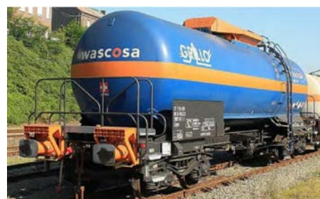
Figuur 1 voorbeeld van overbufferingbeveiliging (oranje) in combinatie met crashbuffers

De inspectie vindt het positief dat de chemiebedrijven: SABIC, OCI Nitrogen en AnQore in lijn met aanbeveling 2a geen operationele lastminutewijzigingen meer doorvoeren. In hun onderzoek naar de risicobeheersing van het vervoer van