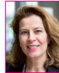
Maryse Ducheine Communicatie