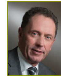
Marc Kuipers Inspecteur-Generaal Inspectie SZW