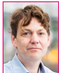
Hans Ton Werknemersregelingen