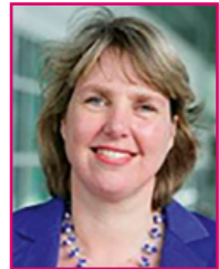
Nicolet Dukker Rijkschoonmaak- organisatie