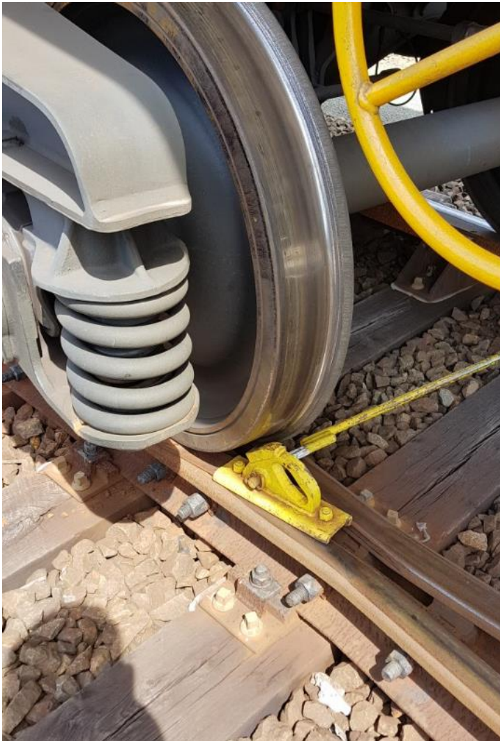
Afbeelding 2; Remslof (geel voor het wiel) zoals aangetroffen op incident locatie