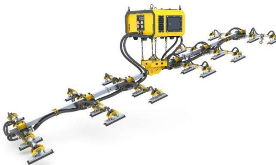
Figuur 2 De LEVO (Six pack lifter)

De techniek beoogt daarmee gevaren die gepaard gaan met het werkproces saneren op hoogte weg te nemen. In onderstaande figuur is de LEVO weergegeven voor een impressie: