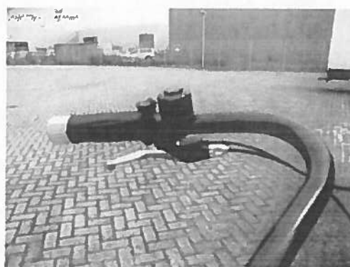
Afbeelding 3. De bel op het stuur

De Swing beschikt niet over richtingaanwijzers. Richting aangeven moet dus gebeuren door de hand uit te steken.