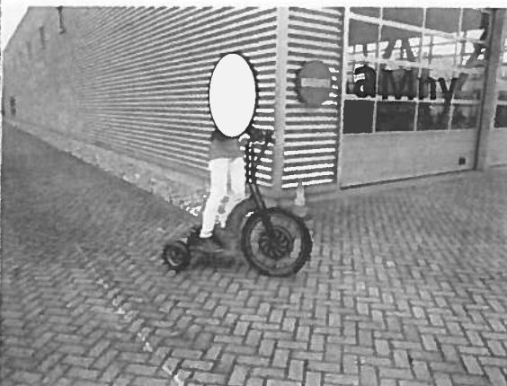
Afbeelding 1a en 1b. De Swing

Met de knijprem aan de rechterkant van het stuur remt men op het voorwiel en met de knijprem aan de linkerkant van het stuur remt men op de achterwielen. Gas (stroom) geeft men door met de duim op een handel te drukken aan de rechterkant van het stuur. De Swing heeft geen verlichting. Aan de achterzijde is een ronde rode reflector bevestigd (zie Afbeelding 2). Aan de linkerkant van het stuur is een bel bevestigd (zie Afbeelding 3). Het stuur is niet op hoogte instelbaar.