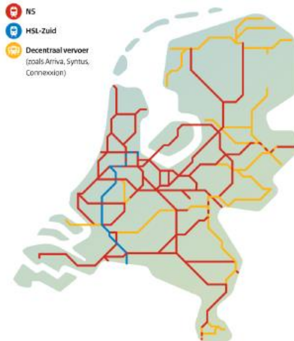
Figuur: personenvervoer op het Nederlandse net (bron: ABDTopconsult (2017), Kiezen voor een goed spoor)

In 2013 is besloten de treindienst Zwolle-Enschede definitief te gaan decentraliseren. Deze treindienst is inmiddels aanbesteed en zal vanaf december 2017 door Syntus (inmiddels Keolis) worden gereden.