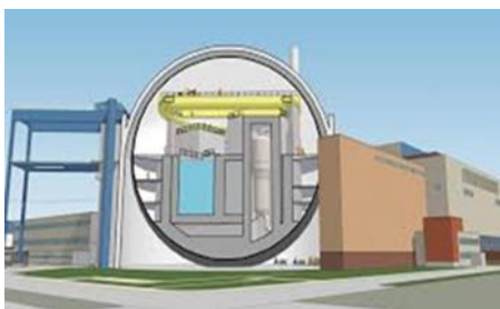
Figuur 2.

In de vroege ochtend van 16 april is om 06.15 uur een gasfles geëxplodeerd in het splijtstofopslagbassin (SOB) bij