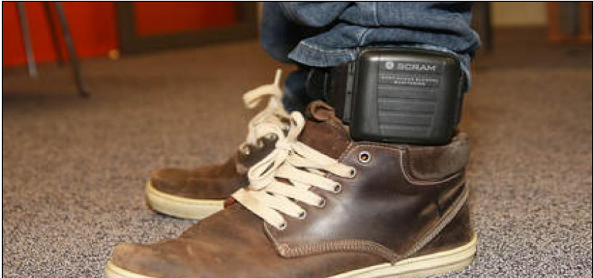
Afbeelding 1.1 Alcoholmeter

De voordelen van transdermale alcoholmetingen ten opzichte van bloed-, urine- of blaastesten zijn 4 :