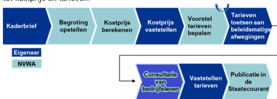
Figuur 1 – Proces van begroting tot tarieven

De jaarlijkse begroting is uitgangspunt voor de voorcalculatie van de kostprijs en de daaruit volgende tariefbepaling. De NVWA doet zowel voor de kostprijs als voor de tariefstelling een voorstel, de eigenaar stelt deze vast. Onderstaand zijn de in opzet geldende hoofdstappen van het proces opgenomen om jaarlijks te komen tot kostprijs en tarieven.