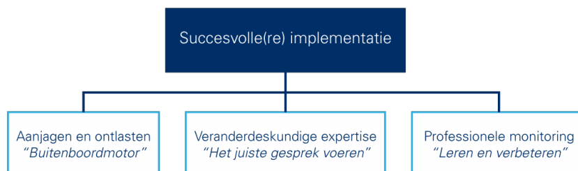
Figuur 3: Mechanismen: de bijdrage van de adviesbureaus aan de implementatie van de projecten van de verpleeghuizen.