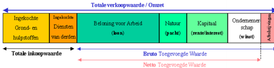
Afbeelding 2.1: Winst is een klein deel van de toegevoegde waarde

Een belangrijk bijkomend voordeel van het werken met winst in plaats van toegevoegde waarde, is dat de investeringen die bedrijven zelf nog zullen doen om de extra opdrachten te realiseren, niet aan de civil engineering kosten van de Brede Sluis en de Amsterdam Route hoeven te worden toegevoegd. Deze kosten zijn niet compleet voor beide alternatieven, het is niet duidelijk in hoeverre ze strik noodzakelijk zijn voor de extra opdrachten en het is onbekend wat hun effect op bedrijfswinsten is. Door eenvoudigweg met een winst per opdracht (dus extra omzet per opdracht maal meerjaren gemiddelde winstmarge) te werken, voorkomen we dat we verstrikt raken in de financiële gegevens van de individuele bedrijven en de vertrouwelijkheid van deze informatie.