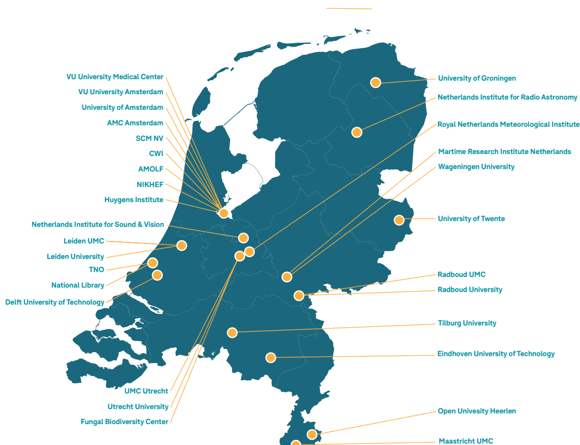
Figure: Map of projects 2014-2018 (Bron: Self-assessment eScience Center 2014 – mid 2018)

Bron: Self-assessment eScience Center 2014 – mid 2018