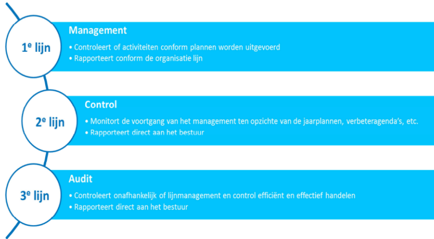
Figuur 1 Three lines of defence

Schematisch kan dat als volgt worden weergegeven: