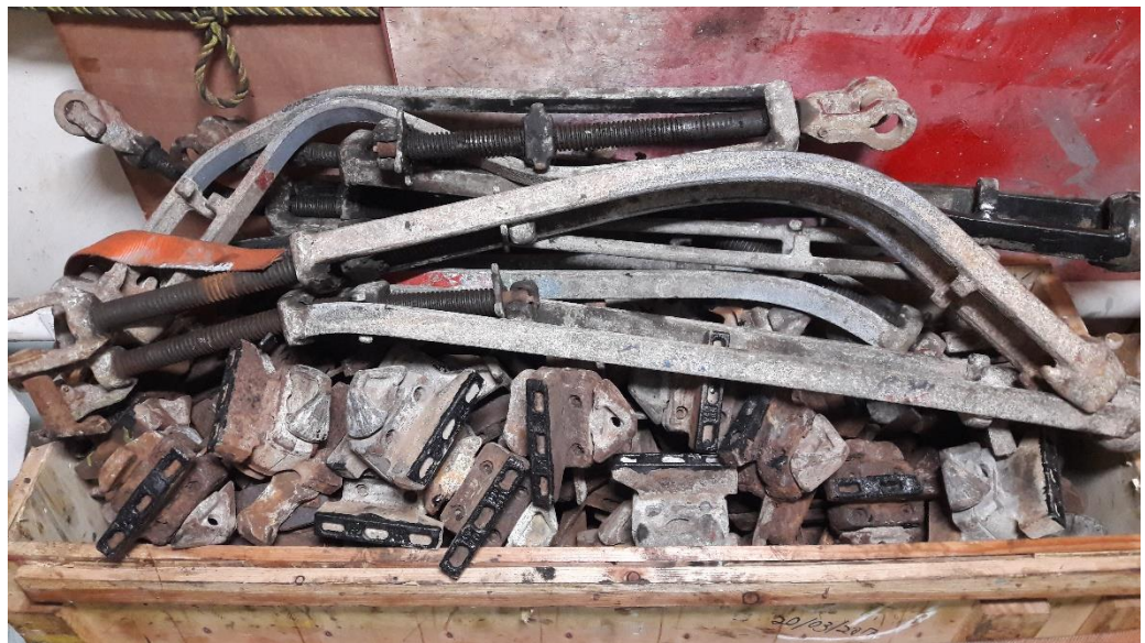
Foto: Beschadigde spanschroefverbindingen op een schip (bron: ILT).

Zo zijn containerschepen door hun vorm gevoelig voor bijvoorbeeld parametrisch slingeren. De slingerhoek kan hierdoor bij sterke wind en hoge golven plotseling tot boven 38 graden toenemen. Bij zulke omstandigheden worden de krachten op de containers aan dek groot. Zelfs zo groot dat containers van het schip in zee kunnen vallen, ook al heeft het sjorbedrijf gesjord volgens het CSM.