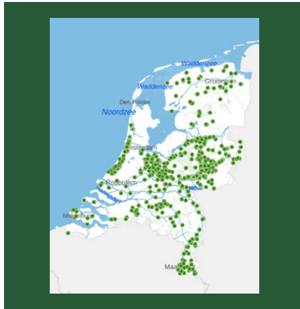
Kaart 1. Overzichtskartaal rijksbeschermd buitenplaatsen 11

kent zo'n 1400 groene rijksmonumenten die zijn opgenomen in het monumentenregister 10 .