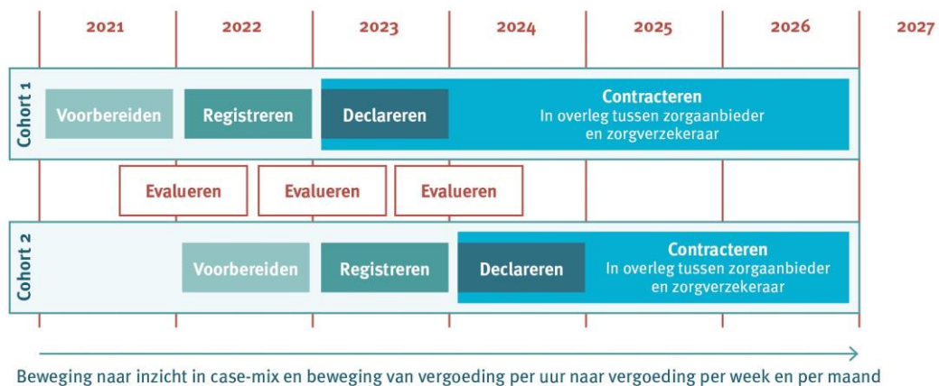
Figuur 2. Start en verloop deelname experiment.

We onderscheiden vier fases voor deelnemers aan het experiment: