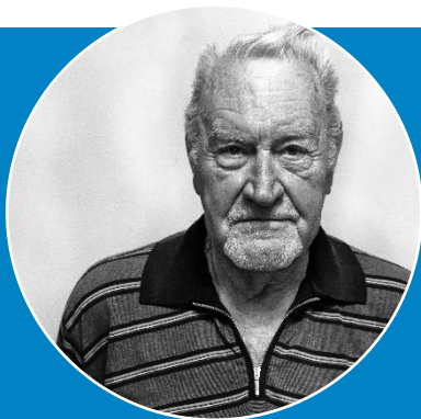
Meneer Mus (87)

Levensverwachting korter dan drie maanden