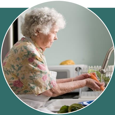
Mevrouw Walters (82)

Laatst zong ze zelfs een solo, als verrassing voor haar kinderen en kleinkinderen die ze allemaal had uitgenodigd. Het maakt haar niet meer uit wat mensen daar van vinden, ook al wil ze absoluut niet truttig gevonden worden. Ook heeft ze veel sociale contacten door het koor, dat vindt ze ook het belangrijkste aspect. Door de Covid-19 maatregelen gaat het koor helaas momenteel niet door. Daardoor zit ze meer thuis en voelt ze zich soms eenzaam. Ze belt wel veel met de mensen van haar koor, zo spreken ze elkaar toch nog regelmatig. Haar andere hobby is lezen, maar haar zicht gaat achteruit dus dit wordt steeds lastiger. Omdat ze gezond probeert te leven en positief in het leven staat ziet ze er altijd stralend uit, maar het is wel eens de vraag of ze zich ook echt zo stralend voelt.