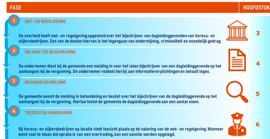
Figuur 1. Proces van bijschrijving en hoofdstukindeling

De antwoorden op de onderzoeksvragen zijn verwerkt in de hoofdstukken 3 t/m 6. Deze vier hoofdstukken zijn ingedeeld op basis van de vier fasen in het proces van het bijschrijven van dagleidinggevenden. Ieder hoofdstuk bevat een objectieve beschrijving van een fase.