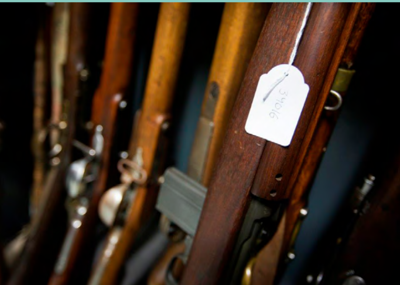
Afbeelding 2 Collectie in een wapendepot met een label waarop het inventarisnummer van één van de wapens is aangebracht.