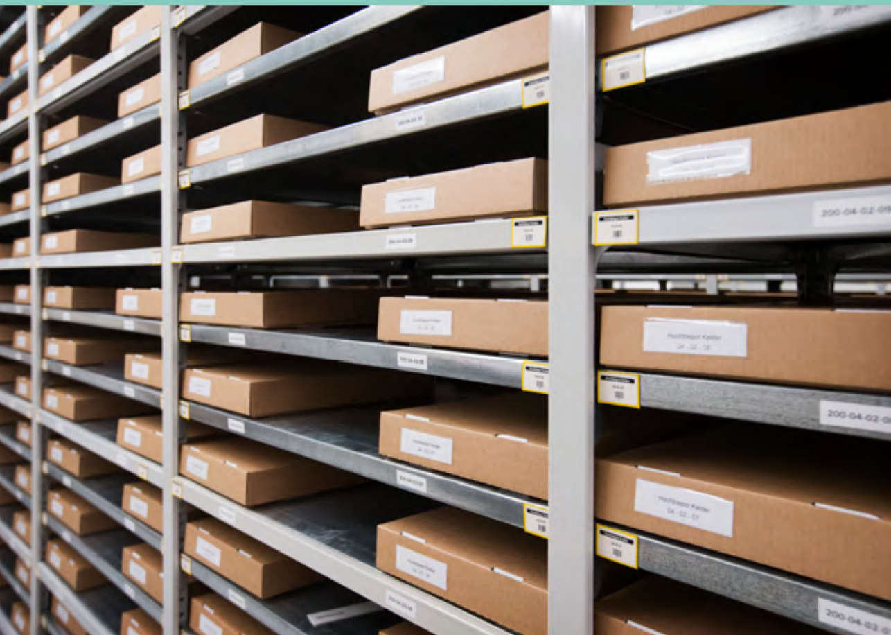
Afbeelding 1 Stellingen in een depot. De barcodelabels maken een efficiënte registratie en controle van de standplaatsen van de collectie mogelijk.