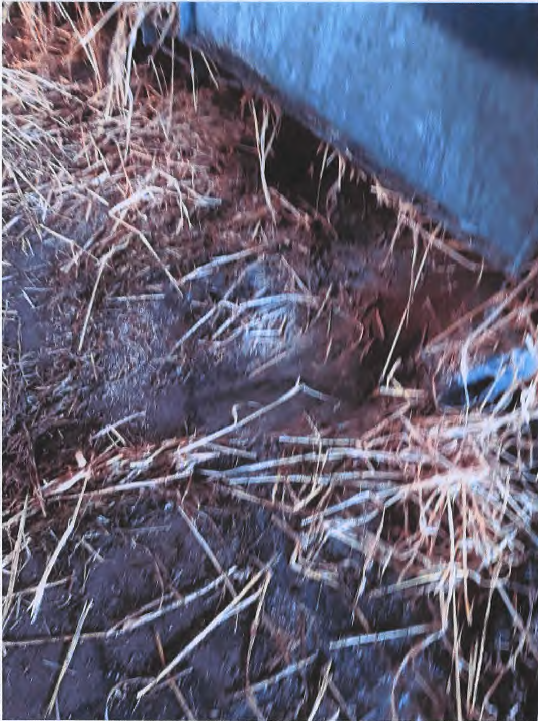
Natte stinkende drab onder de eenlingboxen waarin de twee kalveren werden gehouden.