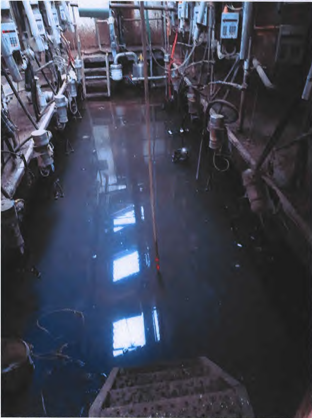
De melkput die al lange tijd onder water stond en waar de elektriciteit niet was afgesloten.