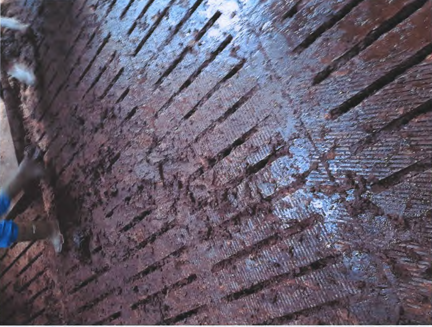
De vervuilde roostervloer in de ligboxenstal.