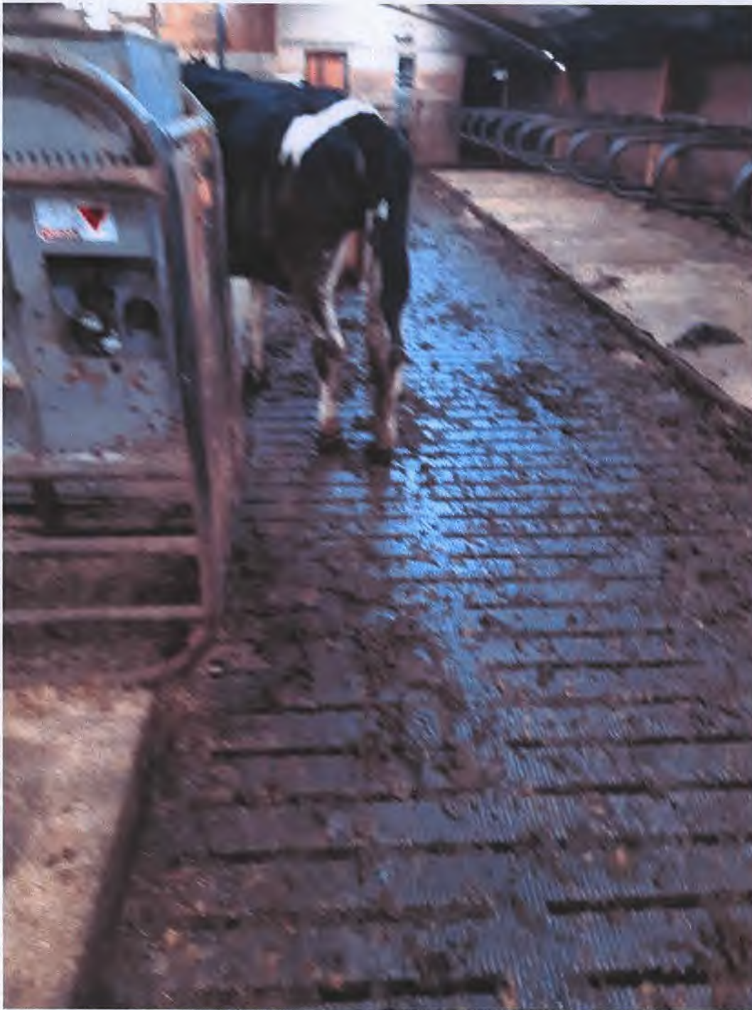
Een van de ernstig kreupele runderen op met mest vervuilde roosters in de ligboxenstal.