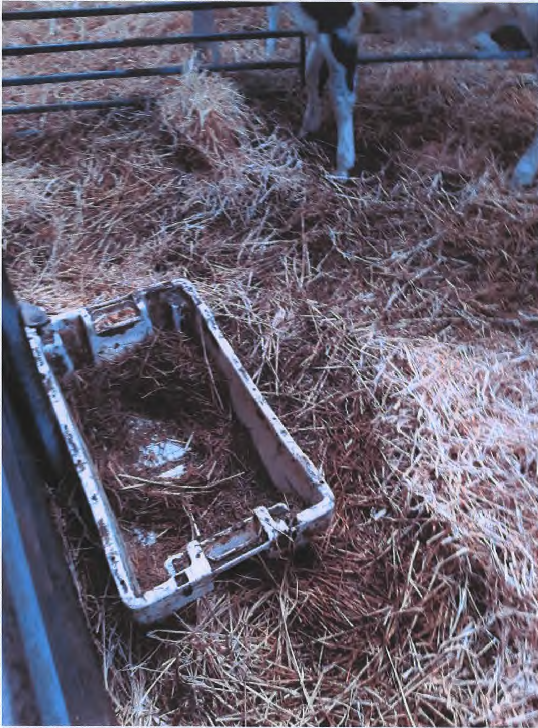
Een sterk vervuilde voerbak met deels gevuld met oud ongeschikt voer in een van de twee hokken waarin kalveren werden gehouden.