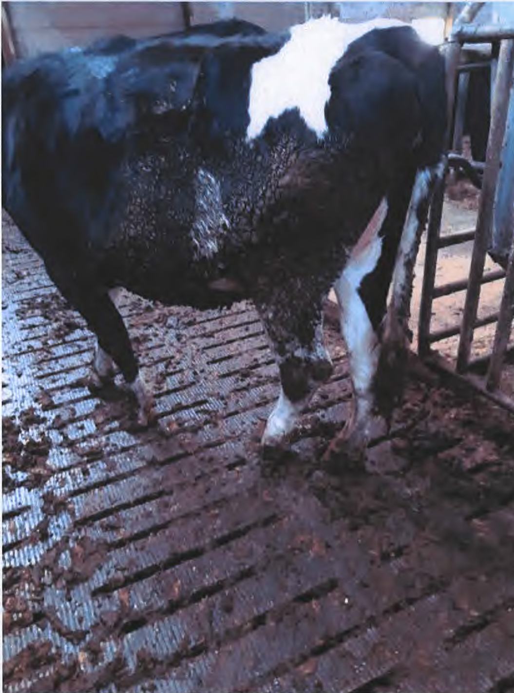
Een van de ernstig kreupele runderen op met mest vervuilde roosters.

Bijlage 04 , 6 foto's van de aangetroffen situatie in de ligboxenstal: