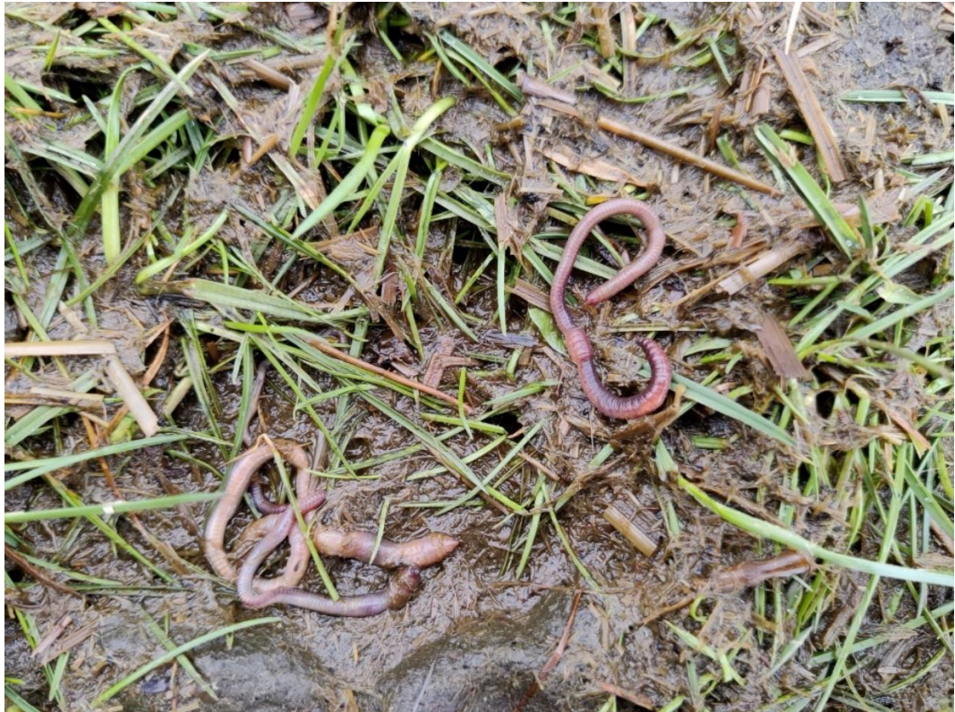
Foto: dode rode regenwormen die naar bovenkomen zijn gekomen (en blijven bij daglicht), omdat na het injecteren van drijfmest het bodemmilieu voor hun zeer ongunstig is.